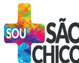
Distorção vertical no símbolo